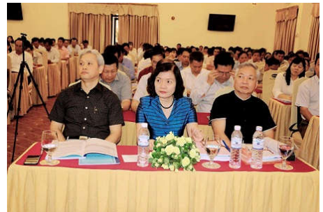
Các đại biểu tham dự Hội nghị