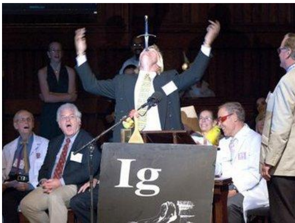
Vui mừng đoạt giải Ig Nobel (Ảnh: www.life.org.uk )

Như thường lệ, trước tuần lễ công bố chính thức giải Nobel, giải Ig Nobel (phản Nobel) năm 2008 đã được tạp chí Annals of Improbable Research công bố hôm 02/10/2008 tại Trường Đại học Harvard, với những giải ngộ nghĩnh trong các lĩnh vực như: sinh học, y học, hóa học, kinh tế và hòa bình.