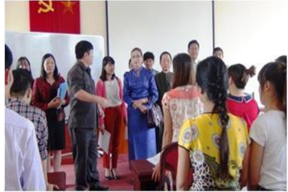
Đoàn lãnh đạo cao cấp Tổng cục Thống kê Campuchia tham quan lớp học tại Viện KHTK

KHTK tư vấn, hỗ trợ xây dựng Chiến lược phát triển Thống kê Campuchia, đào tạo nhân lực thống kê trình độ cao, xây dựng công cụ đánh giá năng lực cơ quan thống kê quốc gia Campuchia.