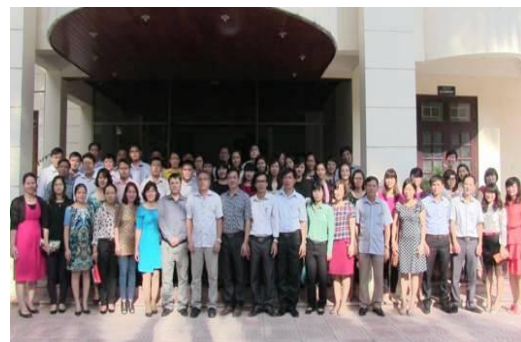
Các học viên Lớp Bồi dưỡng kiến thức quản lý nhà nước (Chương trình Chuyên viên chính)

Sau khi kết thúc khóa học, học viên sẽ được cấp chứng chỉ và đây là một trong những điều kiện cần để các học viên thi chuyển ngạch từ thống kê viên và tương đương lên ngạch thống kê viên chính và tương đương.