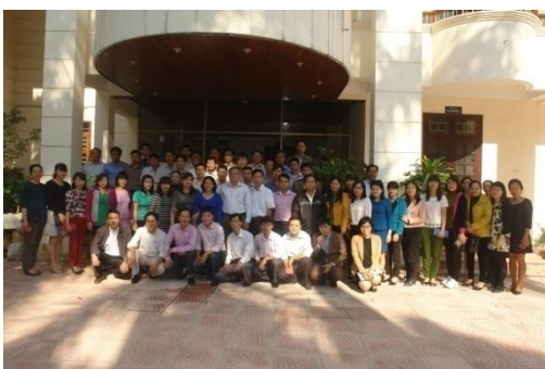
Các học viên Lớp Bồi dưỡng nghiệp vụ công tác thống kê (Chương trình Thống kê viên chính)