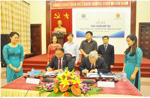
Tổng cục trưởng TCTK và Tổng cục trưởng TCT cùng ký Quy chế phối hợp