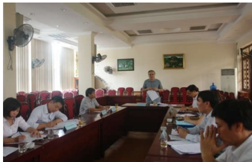
Hội đồng nghiệm thu đề tài: Nghiên cứu áp dụng khuyến nghị của Liên hợp quốc năm 2008 về thống kê công nghiệp vào Thống kê Việt Nam