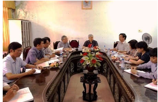
Ban chỉ đạo Trung ương làm việc tại tỉnh Thừa Thiên Huế