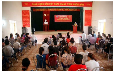
Lễ ra quân giai đoạn 2 TĐT kinh tế 2017 tại quận Lê Chân, Hải Phòng