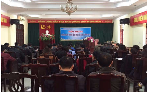
Lễ ra quân giai đoạn 2 TĐT kinh tế 2017 tại huyện Tiên Du, Bắc Ninh

Một số hình ảnh khác về Lễ ra quân giai đoạn 2 TĐT kinh tế 2017 tại các địa phương: