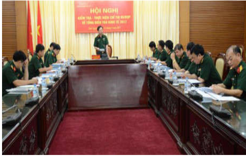
Đoàn công tác kiểm tra Bộ Quốc phòng làm việc tại Bộ tư lệnh Quân khu 1

Ngày 23/5, tại Quân khu 1, Đoàn công tác của Bộ Quốc phòng do Cục Kế hoạch và Đầu tư chủ trì kiểm tra việc thực hiện Chỉ thị số 85/CT-BQP về Tổng điều tra kinh tế năm 2017. Bộ tư lệnh Quân khu 1 đã quán triệt, giáo dục, tuyên truyền sâu rộng tới các cơ quan, đơn vị trực thuộc; kịp thời ban hành các chỉ thị, hướng dẫn, chỉ đạo các cơ quan, đơn vị tổ chức thực hiện Chỉ thị. Đặc biệt, đã tổ chức tập huấn cho 23 cơ quan, đơn vị đầu mối, xây dựng phương án chi tiết, chặt chẽ, sát thực tế. Trong thời gian tới, Quân khu 1 tiếp tục đẩy mạnh công tác tuyên truyền, kịp thời khắc phục những tồn tại, hạn chế, nhằm thực hiện hiệu quả cuộc Tổng điều tra kinh tế năm 2017.