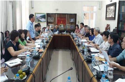
Ban chỉ đạo Trung ương làm việc tại TP. Hà Nội