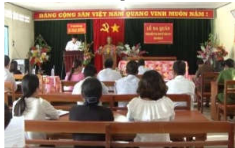
Lễ ra quân giai đoạn 2 TĐT kinh tế 2017 tại huyện Kon Rẫy, Kon Tum