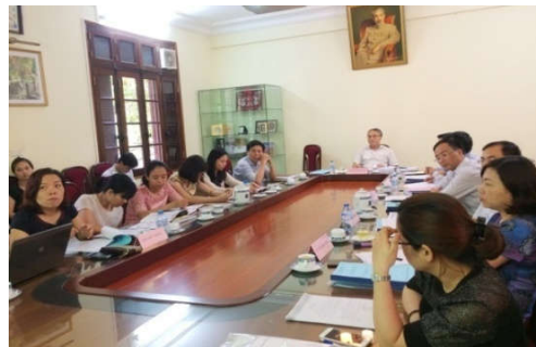
Hội đồng nghiệm thu đề tài: Nghiên cứu xây dựng chế độ báo cáo thống kê cấp quốc gia