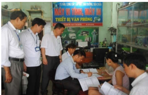
Lãnh đạo Cục Thống kê Thái Nguyên giám sát điều tra thực địa tại thị trấn Hùng Sơn, Đại Từ