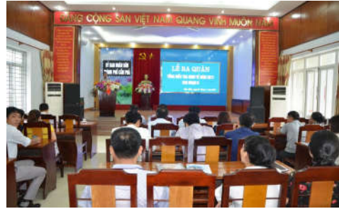
Lễ ra quân giai đoạn 2 TĐT kinh tế 2017 tại thành phố Cẩm Phả, Quảng Ninh