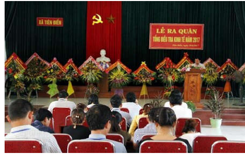
Lễ ra quân giai đoạn 2 TĐT kinh tế 2017 tại xã Tiên Điền, Nghi Xuân, Hà Tĩnh