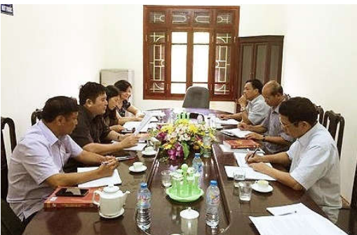
Đoàn giám sát Trung ương làm việc tại tỉnh Hòa Bình