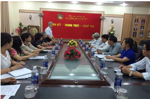
Ban chỉ đạo Trung ương làm việc tại tỉnh Quảng Nam