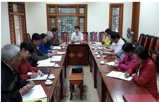
Đoàn giám sát Trung ương làm việc tại tỉnh Thái Bình