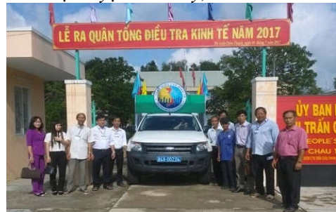
Lễ ra quân giai đoạn 2 TĐT kinh tế 2017 tại thành phố Trà Vinh