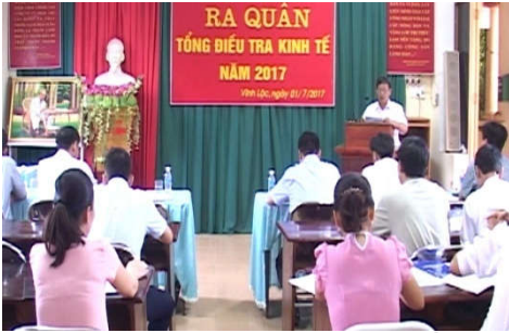
Lễ ra quân giai đoạn 2 TĐT kinh tế 2017 tại huyện Vĩnh Lộc, Tuyên Quang