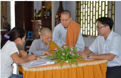
Điều tra viên thu thập thông tin tại chùa Kiều Đàm, Phú Mỹ, Bà Rịa - Vũng Tàu