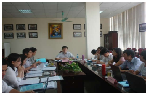
Hội đồng nghiệm thu đề tài: Nghiên cứu phương pháp tiếp cận nghèo theo hướng đa chiều và đề xuất áp dụng ở Việt Nam