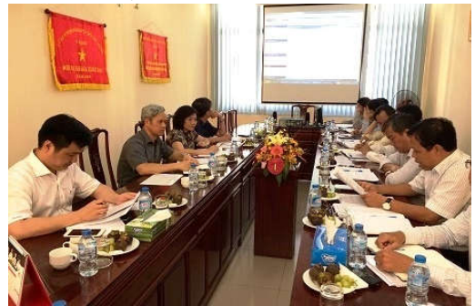
Ban chỉ đạo Trung ương làm việc tại TP. Hồ Chí Minh