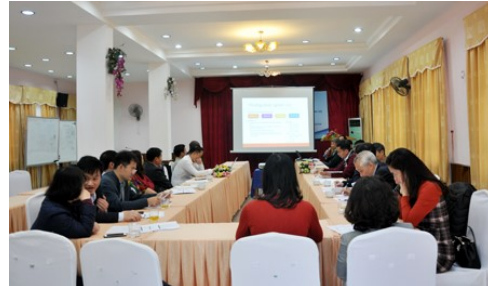
Toàn cảnh Hội thảo

Các đại biểu tham dự Hội thảo được nghe các chuyên gia trình bày Báo cáo về đánh giá và tích hợp dữ liệu hành chính về thuế cho sản xuất thông tin chính thức và các tham luận.