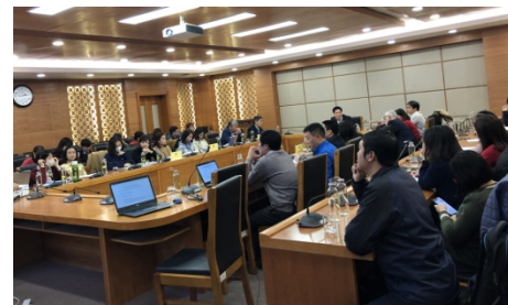
Toàn cảnh lớp tập huấn

Đây là nội dung quan trọng liên quan không chỉ các đơn vị có cuộc điều tra chọn mẫu hộ gia đình, mà còn cả các đơn vị có các cuộc điều tra chọn mẫu khác và đơn vị nghiên cứu phương pháp luận.